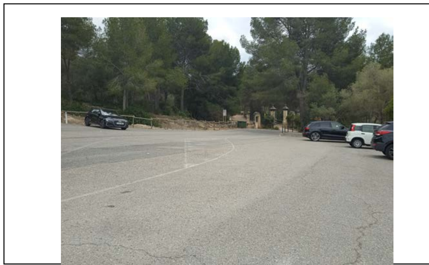
Imatge 2: Vegetació