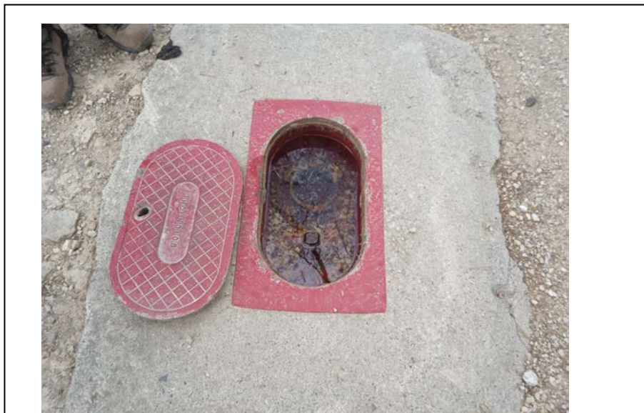
Imatge 5: Hidrant existent i punt d'escomesa