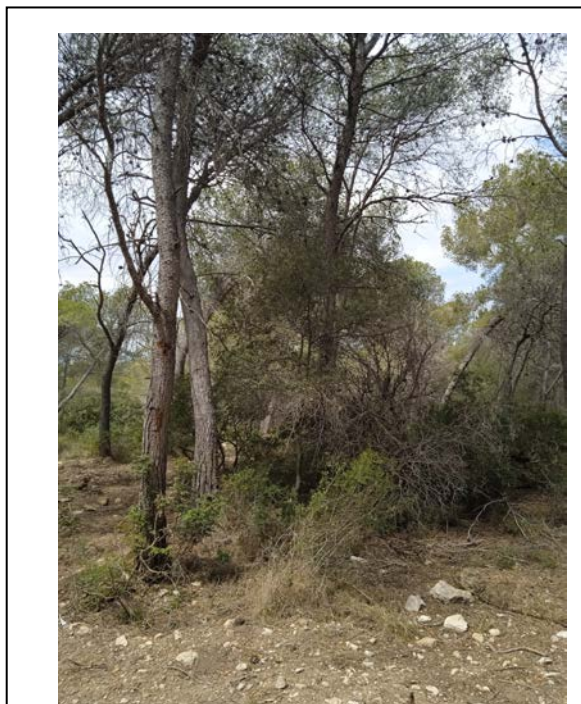
Imatge 3: Tipologia de vegetació