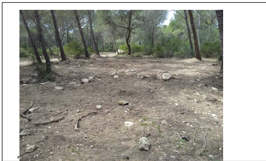
Imatge 4: Tipologia de vegetació